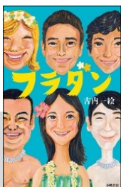
『フラダン』 古内 一絵／作 小峰書店 2016年

新型コロナウイルスにより自由に外出できない世界で、オンラインを通してつながった少女たち5人がダンスユニットを結成！ いつか広い空の下で、一緒に踊れる日を夢見る少女たちの目線で描かれた、近未来が舞台の小説。