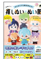
『はじめてでも絶対作れる！ かわいい推しぬい＆ぬい服』 グッズプロ／制作 まるまゆ／監修 たきゆうと／監修 西東社 2023年

小・中・すわりの3タイプのボディとさまざまな髪型＆洋服を組み合わせれば、イメージ通りの推しぬいが作れる！ デフォルメがかわいい2頭身の推しぬいの作り方を、プロセス写真や図でわかりやすく解説。