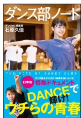
『ダンス部ノート』 石原 久佳／著 ベストセラーズ 2019年

ひとつの文化として根付きつつある高校ダンス部。本書では、全国の高校ダンス部から6校を取り上げ、厳しい練習に臨む様子に加えて、生徒たちの不安や葛藤、気付きなどを綴ったノートを紹介。ダンスを通じて日々成長していく姿を追ったドキュメント。