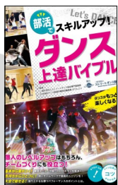
『部活でスキルアップ！ ダンス上達バイブル』 のりんご☆／監修 メイツ出版 2019年

ひとつの文化として根付きつつある高校ダンス部。本書では、全国の高校ダンス部から6校を取り上げ、厳しい練習に臨む様子に加えて、生徒たちの不安や葛藤、気付きなどを綴ったノートを紹介。ダンスを通じて日々成長していく姿を追ったドキュメント。