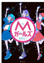
『Mガールズ』 濱野 京子／著 静山社 2021年

ストリート系ダンスの基本動作から、ダンス部設立の方法や衣装の工夫、大会に向けた精神面でのアドバイスまで、幅広く記されている。部活動はもちろん、ダンスの授業にも役立つ一冊。