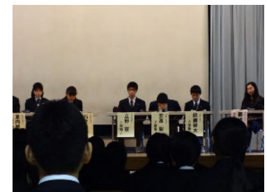
生徒によるパネルディスカッション。