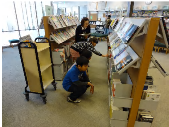
予約された本を棚（書架）から探しているところ。

体験後、3人に感想を尋ねたところ、カウンターの仕事と、予約本の引き抜きがおもしろかったとのことでした。