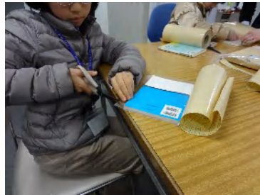
本にフィルムカバーを貼る作業。