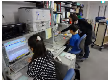
ブックポストの本を返却しています。