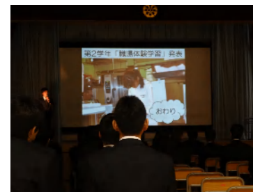
プロジェクターで活動を説明しています。

「仕事をする上で何が重要か」というパネルディスカッションでは、図書館で職場体験をした生徒がパネラーとして、積極的に発言をしていました。