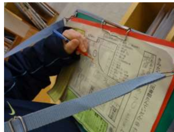
みんな、夢中になって、ミッションをクリアしていました。

来年も、こもれば大和田図書館で、新たな『たんていだん』が活躍することを楽しみにしています。