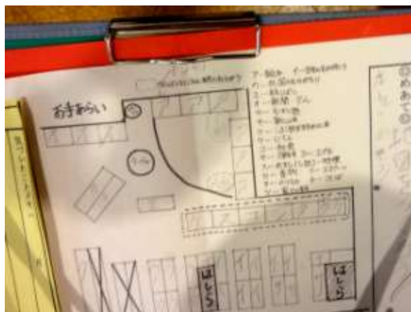
本の種類をアイウエオ順に分類して、地図にしています。

国語と生活科の授業の一環とのことで、先生はこの授業のために、何度も図書館を下見にいられていました。