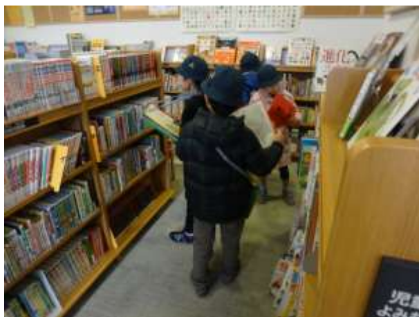
“図書館はかせ”が探している本は、見つかったかな？

ひとつは、図書館の児童コーナーの地図をつくること、もうひとつは、はかせが必要としている本を図書館の棚から見つけ出すことです。