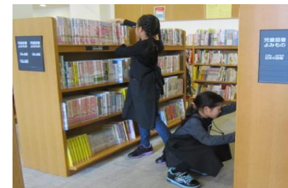
< 本棚の整理も大事な仕事のひとつです >