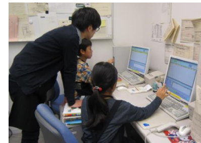
< パソコンの使い方を教えてもらいます >