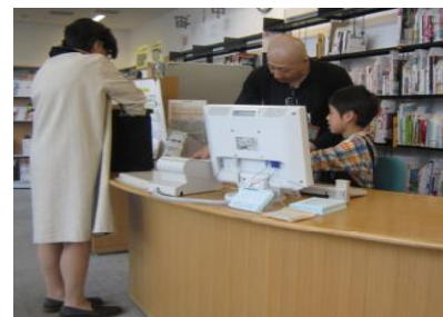
< いよいよカウンターに座ってお仕事です！ >