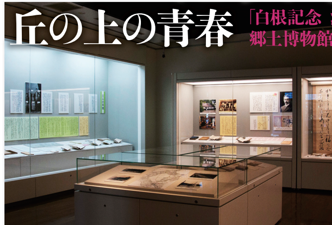
企画展展示室。企画展は3月24日まで。白根記念渋谷区郷土博物館・文学館 渋谷区東四丁目9-1 TEL 03-3486-2791