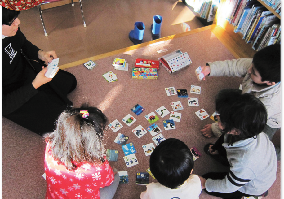
カルタにみんなで集中!

た。千代紙と紙皿で作ったおひなさまは、ゆらゆらと揺れてとても楽しそうでした。 今年の始めには、カルタ会も行いました。アンパンマンやはらべこあおむしのカルタを使って、白熱したカルタ会となりました。 3月の「おはなしとこうさく会」はお休みですが、4月は「こども読書の日」にちなんだこうさく会を開催します。楽しいこうさくを用意してお待ちしています！