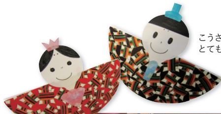
こうさく会で作ったひな人形。とてもかわいくできました。