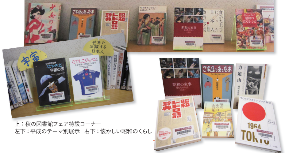
上:秋の図書館フェア特設コーナー 左下:平成のテーマ別展示 右下:懐かしい昭和のくらし

大人の方は懐かしく、子どもたちは今と昔のくらしを比べて楽しんでもらえればと思います。展示中の本は貸し出しも出来ますので、是非お手にとってご覧下さい。