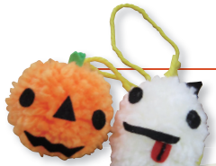
10月のこうさく会はハロウィンでした。