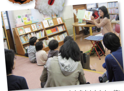
おかあさんたちも一緒に