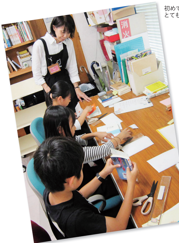
初めてのカバーかけ とても丁寧に作業してくれました。

そうに働いてくれました。最後に5人それぞれにおすすめの1冊を選んでもらいました。紹介文やイラストも書いてもらって展示したところ、図書館に来た小学生の注目を集め、あつという間にすべてが貸し出されてしまいました。そのまま本の帯にしたい程の、素敵な文と絵でした。次回は来年3月に行う予定です。皆様ぜひご参加下さい。