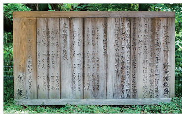
年月を感じさせる説明板。サンクチュアリを訪れる鳥や、鳥の好む木の名前が書かれている。

野鳥も名前を知っていると、より親しみが湧くことでしょう。そんな時に役に立つのが野鳥図鑑です。秋の一日、図鑑を片手に代々木公園を訪れてみて下さい。野鳥たちの声や姿に心が和むことでしょう。