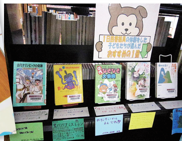
上：カウンターで資料画面を確認中。 下：一日図書館員おすすめの1冊コーナー