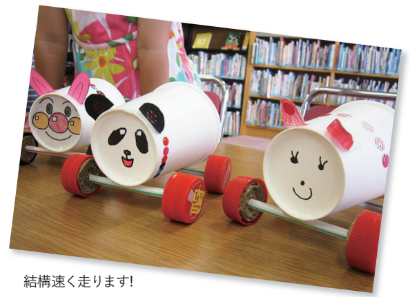
結構速く走ります！

代々木図書館では、毎月第三土曜日15時からおはなしとこうさく会を行っています。8月のこうさく会は、みんなが大好きな車を作りました。題して「ドライブブーブー」。 紙コップの底面に好きな顔を描いてもらい、自由に飾り付けした後は、ペットボトルの蓋で作った車輪を着けて出来上がり！独創性に富んだ可愛らしいものが出来上がりました。完成後はみんな息をフーフー吹きかけ、競争の始まり始まり♪ 楽しく賑やかなこうさく会でした。 おはなしとこうさく会は、乳幼児など小さなお子さんでも安心してご参加頂けます。たくさん子どもたちの参加を、楽しい絵本と一緒に待っています！