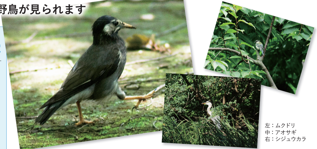
左：ムクドリ 中：アオサギ 右：シジュウカラ