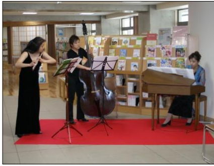
素敵な生演奏で、会場を明るくしてくれました。