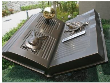
入口のモニュメント