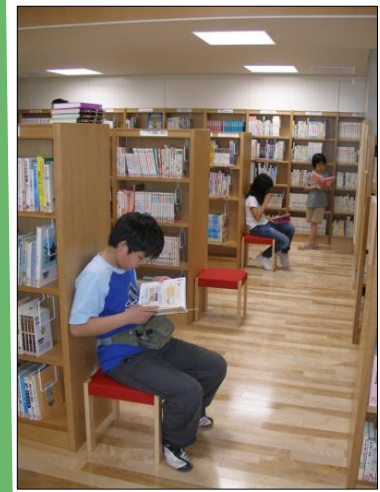
きれいになってうれしいね！