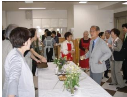
喫茶コーナーのボランティアの皆さんと区長。