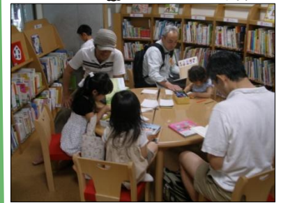
家族連れでたくさんの方々が来てくれました。