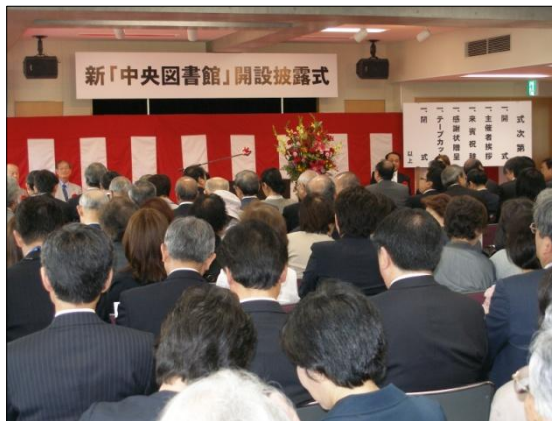
開設披露式では、たくさんの方々に集まっていただきました。