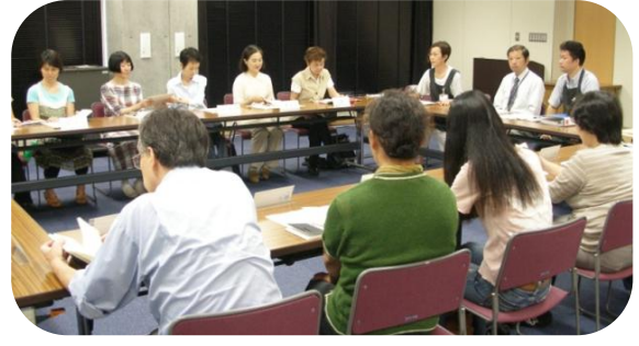
読書推進ボランティアのみなさん。(9/16説明会にて)